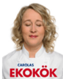
Carolans ekokök : mat som smakar på riktigt